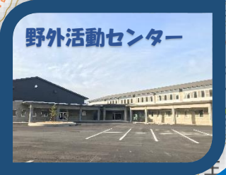
野外活動センター