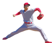
岩手県営野球場 応援風景