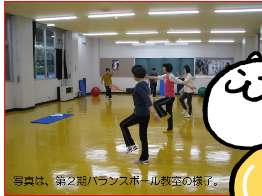
写真は、第2期バランスボール教室の様子。

第1回 12/6 (木) 1回 300円 会員券 1,500円 1回のみ参加もOK★