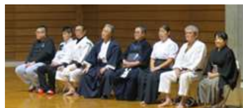
(各武道教室の先生方)

13:00 開始式 13:10 演武(各団体10分) ・弓道・空手道・なぎなた ・剣道・合気道・少林寺拳法 ・柔道・相撲 14:45 閉会式 餅まき交流会