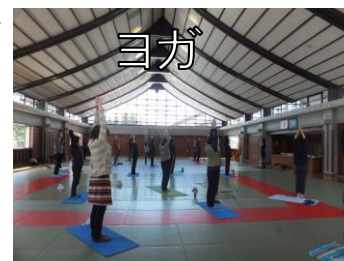
[昨年度の活動風景]