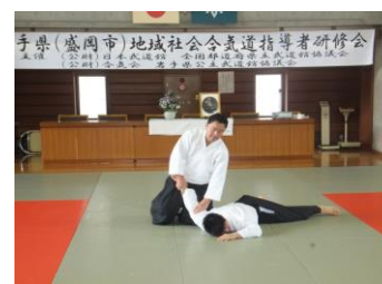
[昨年度実施した錬成大会(なぎなた・弓道)及び指導者研修会(少林寺拳法・合気道)の様子]