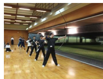
[昨年度の活動風景]